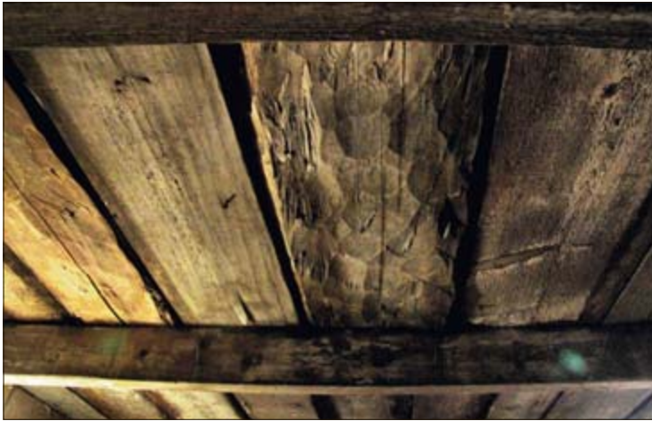
MASSIVE BJELKER: En gammel stall fra 1700-tallet gjenoppstår, her er de massive originale takbjelkene.