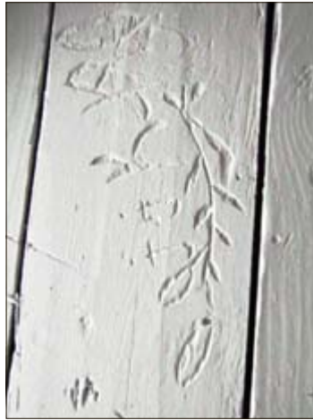
PÅ DØRA: Noen har kjedet seg eller hatt et behov for å udødeliggjøre skribleriene sine.